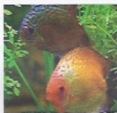
2 Il y a _____ dans l'aquarium.