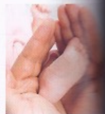
8 Le bébé a _____.