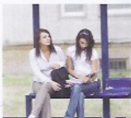
5 _____ sont assises sur le banc.