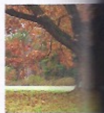
4 En automne, _____ des arbres sont _____.