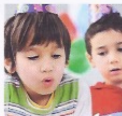
7 _____ sont à _____ une fête d'anniversaire.