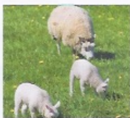
1 _____ mangent de l'herbe.

poisson brebis fille souris feuille petit pied enfant dent