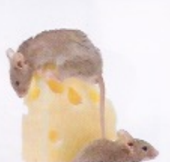
6 _____ adorent le fromage.